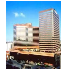
โรงแรมสริซิลโฮเทล เลอ คองคอร์ด

ที่อยู่ 204 ถ.รัชดาภิเษก ห้วยขวาง กรุงเทพฯ 10320