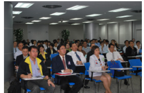
บรรยายภาคภายในห้องสัมมนา