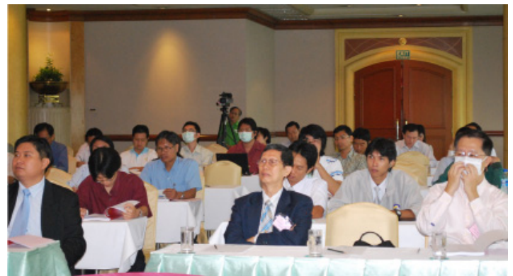
บรรยายภาคภายในห้องสัมมนา