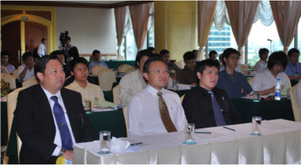
บรรยากาศภายในห้องสัมมนา