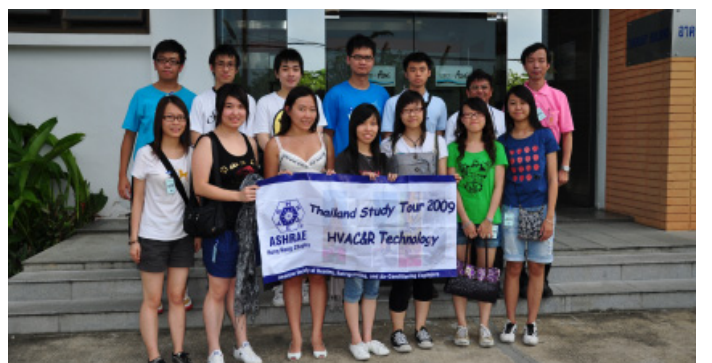
สมาชิกนักศึกษาจาก Hong Kong Chapter เยี่ยมชมดูงานโรงงานผู้ผลิตเครื่องปรับอากาศชั้นนำของไทย ณ โรงงานเครื่องปรับอากาศศูนย์แอร์