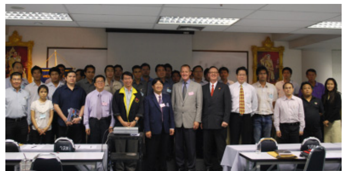
วิทยากรและกรรมการถ่ายภาพร่วมกับผู้เข้าสัมมนา