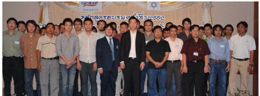
วิทยากรและกรรมการถ่ายภาพร่วมกับผู้เข้าสัมมนา

1-2 ตุลาคม 2552 ASHRAE Thailand Chapter ร่วมกับ สมาคมวิศวกรรมปรับอากาศแห่งประเทศไทย จัดอบรม เรื่อง “การออกแบบและติดตั้งระบบน้ำเย็นสำหรับระบบปรับอากาศ” ณ ห้องพาโนรามา ชั้น 14 โรงแรมดิเอ็มเมอรัล ถนนรัชดาภิเษก