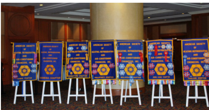
ธงสัญลักษณ์ Chapter ทั้ง 7 ที่เข้าร่วมประชุมในครั้งนี้