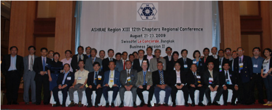
ตัวแทนผู้บริหารจาก 7 Chapters ร่วมถ่ายรูปกับตัวแทนจาก ASHRAE สำนักงานใหญ่

เมื่อวันที่ 21-22 สิงหาคม 2552 ที่ผ่านมา ณ โรงแรมสวิสโฮเทล เลอ คองคอร์ด ถ.รัชดาภิเษก ASHRAE Thailand Chapter ได้รับเกียรติเลือกให้เป็นเจ้าภาพจัดงานประชุมประจำปีของ ASHRAE Chapter ในภูมิภาค 13 ซึ่งประกอบด้วยประเทศสมาชิก 7 ประเทศ คือฮ่องกง, สิงคโปร์, มาเลเซีย, ไต้หวัน, ฟิลิปปินส์, ไทย และอินโดนีเซีย โดยในการประชุมครั้งนี้ มีสมาชิก ASHRAE (และสมาชิกประเภทนักศึกษา) จากประเทศต่างๆ และตัวแทนจาก ASHRAE สำนักงานใหญ่ เดินทางมาร่วมงานกว่า 180 คน