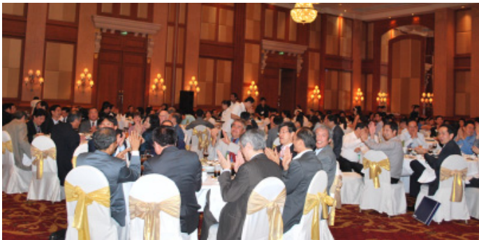
บรรยากาศช่วงงานเลี้ยงสังสรรค์ Banquet Dinner