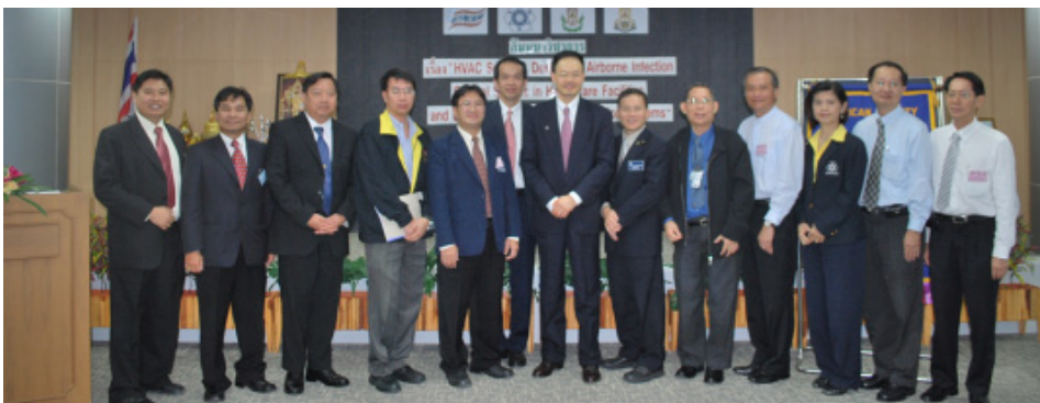
กรรมการถ่ายภาพร่วมกับวิทยากร