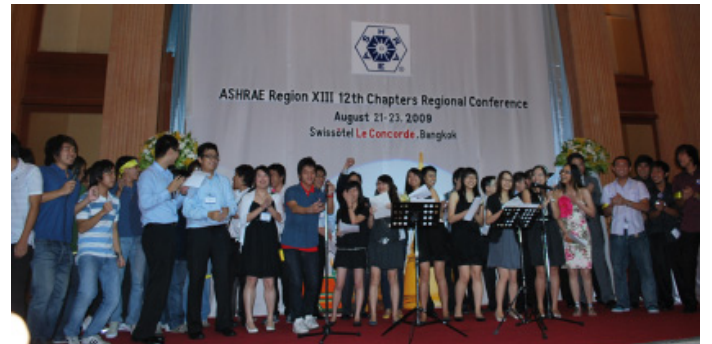
ตัวแทนสมาชิกประเภทนักศึกษาจาก Chapter ต่างๆ แสดงกิจกรรมร่วมกัน