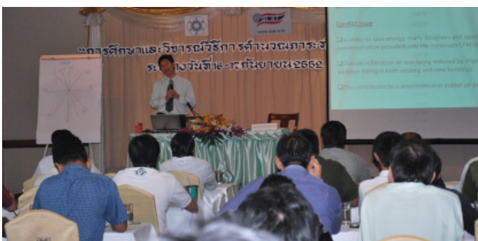
บรรยากาศภายในห้องสัมมนา