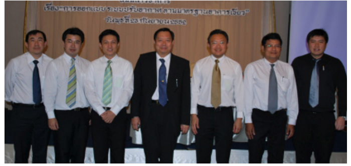
กรรมการถ่ายภาพร่วมกับวิทยากร

23 กันยายน 2552 ASHRAE Thailand Chapter ร่วมกับ สมาคมวิศวกรรมปรับอากาศแห่งประเทศไทย จัดสัมมนาวิชาการ เรื่อง “การออกแบบระบบปรับอากาศตามมาตรฐานอาคารเขียว” ณ ห้องพาโนรามา ชั้น 14 โรงแรมดิเอ็มเมอรัล ถนนรัชดาภิเษก