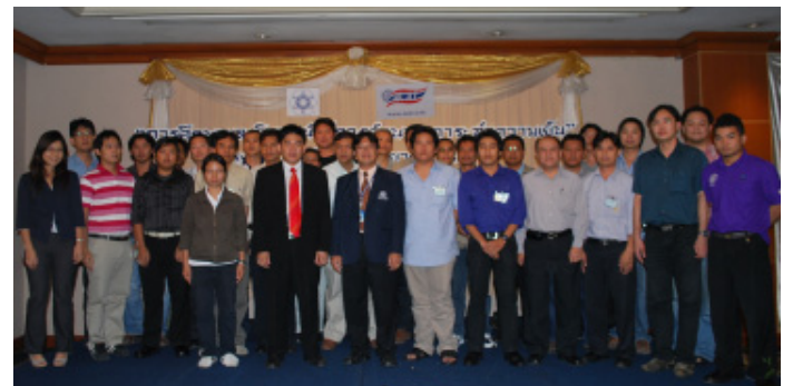
วิทยากรและกรรมการถ่ายภาพร่วมกับผู้เข้าสัมมนา

16-17 กันยายน 2552 ASHRAE Thailand Chapter ร่วมกับ สมาคมวิศวกรรมปรับอากาศแห่งประเทศไทย จัดหลักสูตรอบรมเรื่อง "การคำนวณภาระการทำความเย็นด้วยวิธี CLTD" ณ ห้องพาโนรามา ชั้น 14 โรงแรมดิเอ็มเพอร์วัลด์ ถนนรัชดาภิเษก