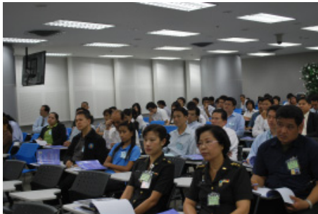
บรรยายภาคภายในห้องสัมมนา