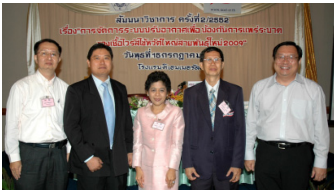
วิทยากรถ่ายภาพร่วมกับกรรมการ